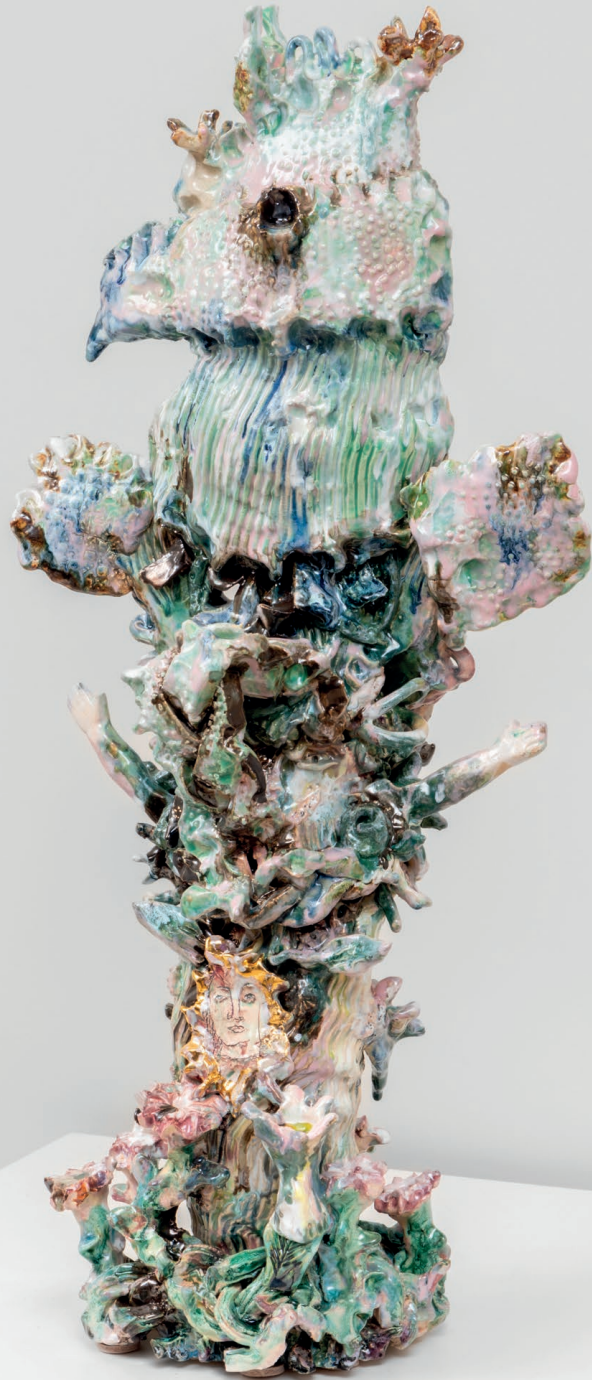
Pénélope Glazed ceramic Céramique émaille