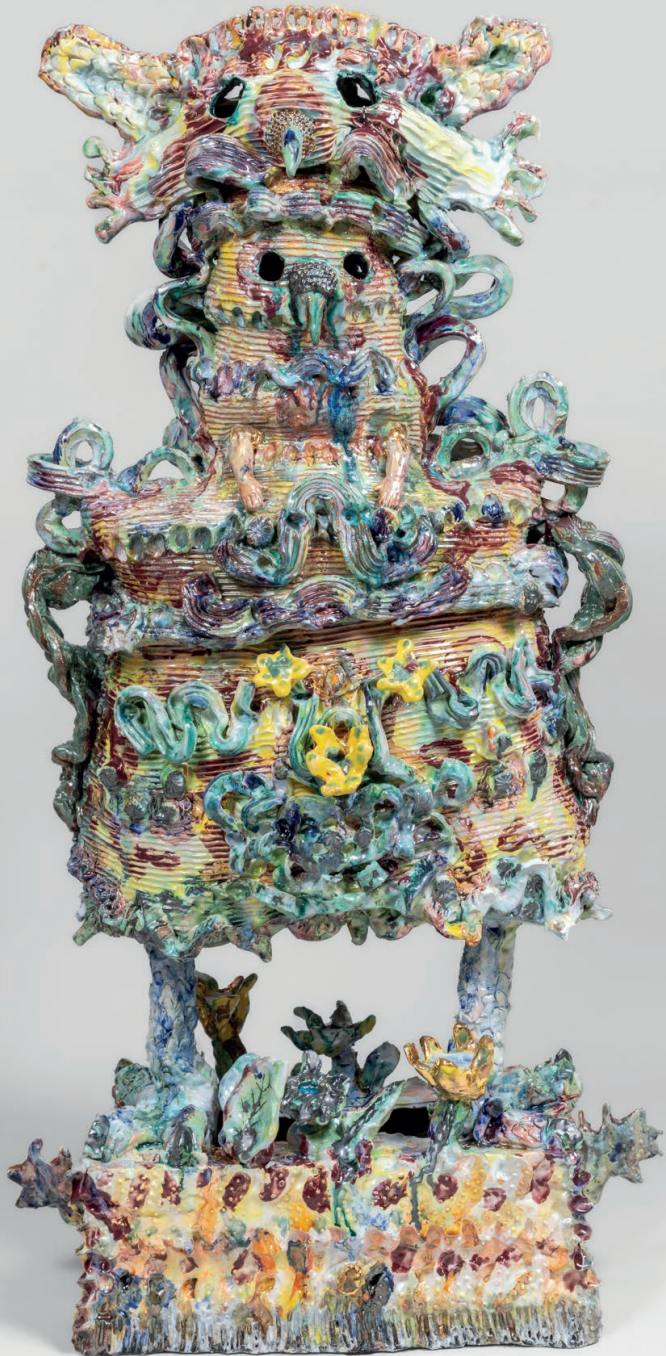
L'oiseau du jardin Glazed ceramic Céramique émaillée