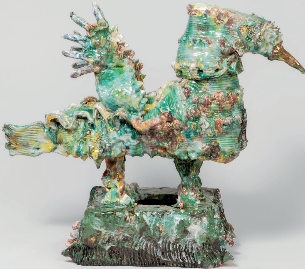
L'envol du sphinx Glazed ceramic Céramique émaillée