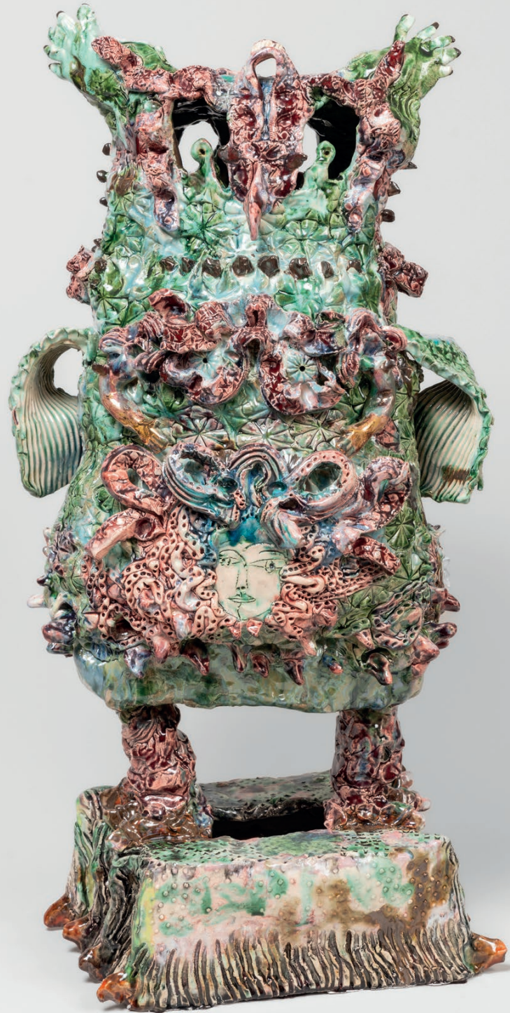
Hibou Chéri II Glazed ceramic Céramique émaillée